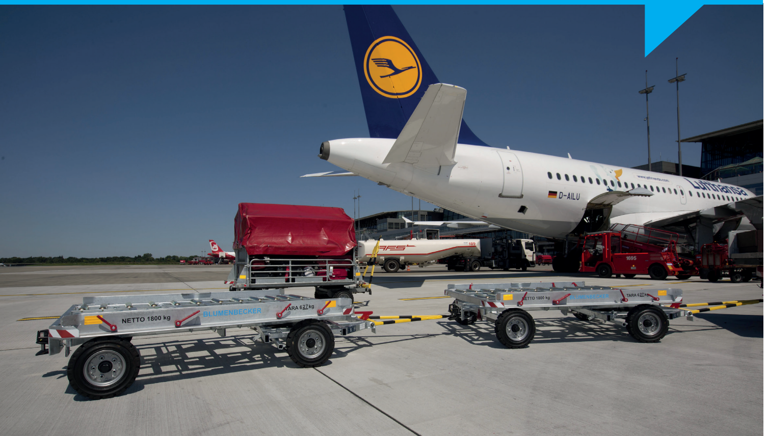
Abbildung: DOLLY D 05.201-T-DR

Der Dolly D 05.201-T-DR der Blumenbecker Technik GmbH wurde für den Transport von Paletten und Containern unterschiedlicher Formate entworfen, konstruiert und gebaut. Die maximal zulässige Belastung beträgt 1800 kg .